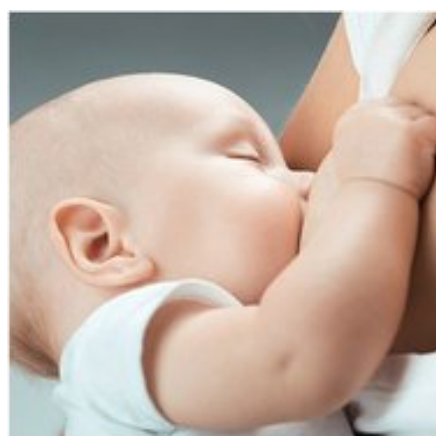
Salud TE CONTAMOS POR QUÉ SON IMPORTANTES LOS LACTORIOS